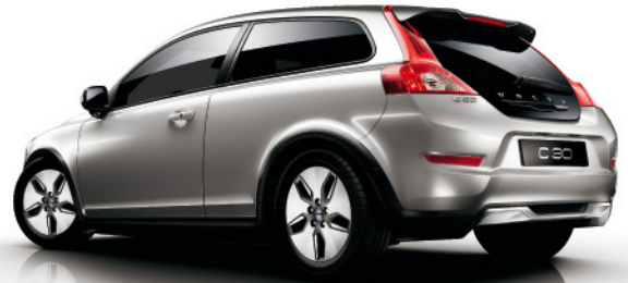
VOLVO C30 DE 100 A 230 CV. CONSUMO PONDERADO (l/100 Km.) DE 3,8 A 9. EMISIONES CO 2 (gr/Km.) DE 99 A 211.

0% Impuesto de matriculación Versión DRiVe. Emisiones CO 2 99gr/Km. Desde 23.240 €*