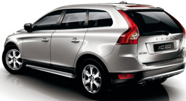
VOLVO XC60 DE 163 A 304 CV. CONSUMO PONDERADO (l/100 Km.) DE 5,9 A 10,7. EMISIONES CO 2 (gr/Km.) DE 154 A 249.

0% Impuesto de matriculación Versión DRiVe. Emisiones CO 2 99gr/Km. Desde 37.890 €*