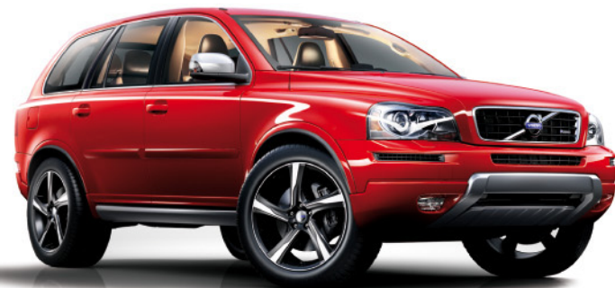
VOLVO XC90 DE 163 A 200 CV. CONSUMO PONDERADO (l/100 Km.) DE 8,3 A 8,5. EMISIONES CO 2 (gr/Km.) DE 219 A 224.

Ronda 15 www.ronda15.es ronda15@ronda15.es