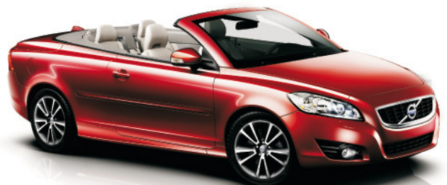
VOLVO C70 DE 150 A 230 CV. CONSUMO PONDERADO (l/100 Km.) DE 5,8 A 9,4. EMISIONES CO 2 (gr/Km.) DE 154 A 219.

Volvo XC90. Se adapta a cualquier plan y hace sitio a todo el que quiera apuntarse: hasta siete plazas en este SUV de última generación.