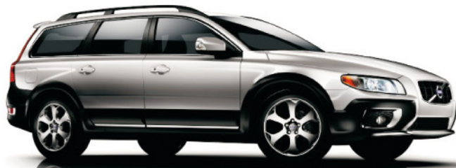
VOLVO XC70 DE 163 A 304 CV. CONSUMO PONDERADO (l/100 Km.) DE 5,9 A 10,6. EMISIONES CO 2 (gr/Km.) DE 154 A 248.

Volvo C70. Dos mundos, dos espacios, dos vehículos en uno; duplica tus vivencias. De cupé a cabrio en 30 segundos, ¿cubierto o descapotable?